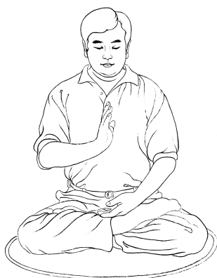
Držanje dlana uspravno