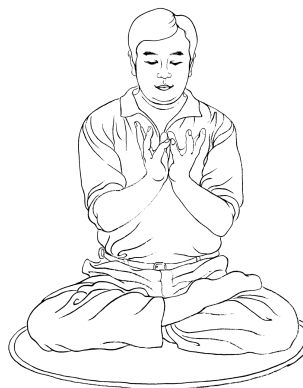
Pozicija ručnog lotosa